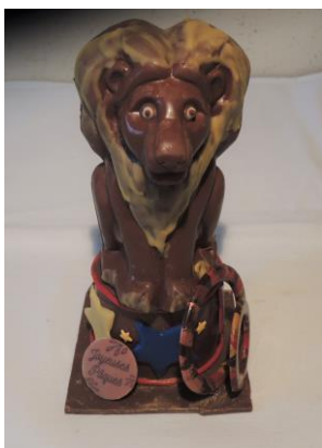
Lion sur son piédestal 18 € Va-t-il sauter dans les cerceaux ? Env 235 g h 18 cm