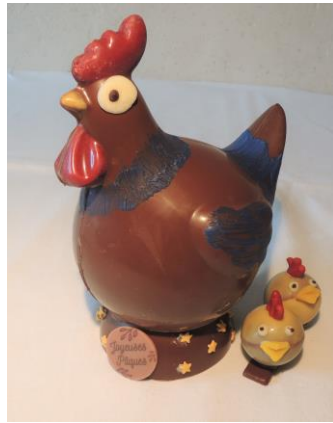
Une grosse poule et ses poussins 24 € Env 300g h 17 cm