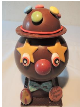
Clown 24 € Env 300g h 17 cm