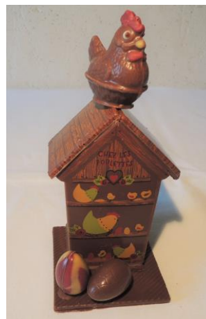
Le poulailler 16 € Env 230g h 19cm