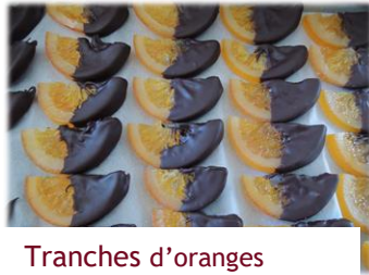
Tranches d'oranges 6 € les 100g