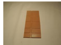
Nouveau ! Tablette chocolat ambré 4 €