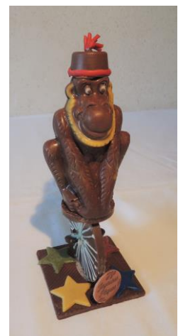
Singe sur son vélo 1 roue 14 € Env 165 g h 20 cm