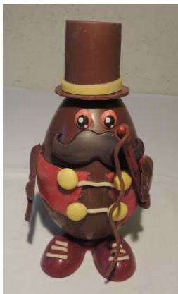
Dompteur 20 € Env 275g h 17 cm