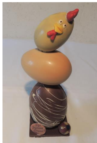
Le poussin équilibriste 18 € Env 230g h 23cm