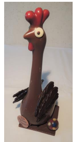
Le coq au fier plumage 18 € Env 230g h 22cm