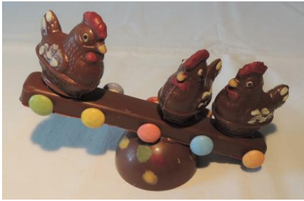
Les petites poules sur une balançoire 12 € Env 110g largeur : 17 cm