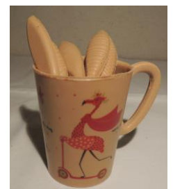
Mug 12 € Env 160g h 10 cm