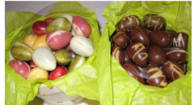
Œufs pralinés Noir, Lait & blanc (Colorants naturels) 6 € les 100g