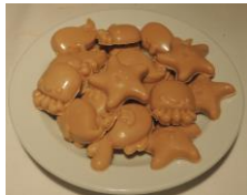
Nouveau ! Friture de Pâques Chocolat ambré