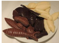
Friture de Pâques 6 € les 100g