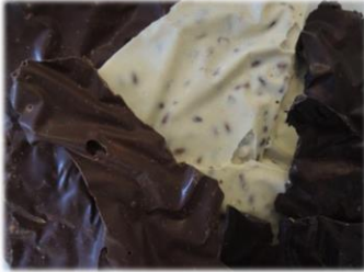
Concassé 6 € les 100g