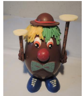
Clown jongleur 18 € Env 245g h 17cm