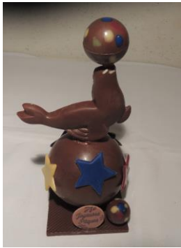
Otarie et son ballon 16 € Env 190g h 20cm