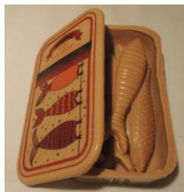
Boîte sardines » 155 g hauteur : 10 cm 12 €