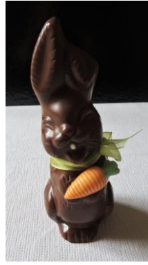
Lapinette ou lapinou Env 110g - hauteur 17 cm 7 €