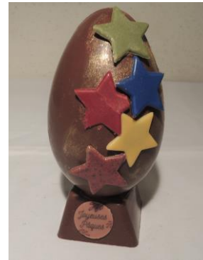
Œuf ballon étoiles 17 € Env 210g h 16cm