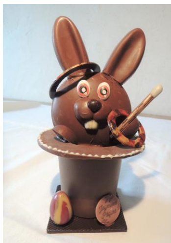
Lapin sortant du chapeau 22 € Env 270 g h 22 cm